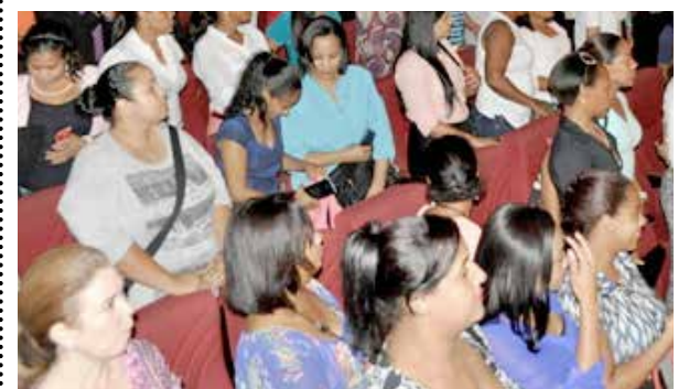
Decenas de jóvenes estudiantes congregadas en el Auditorio Manuel del Cabral, de la Biblioteca Pedro Mir.

Esta actividad contó con la presencia de un nutrido grupo de académicos, profesionales de la salud, estudiantes y empleados de la institución de estudios superiores.