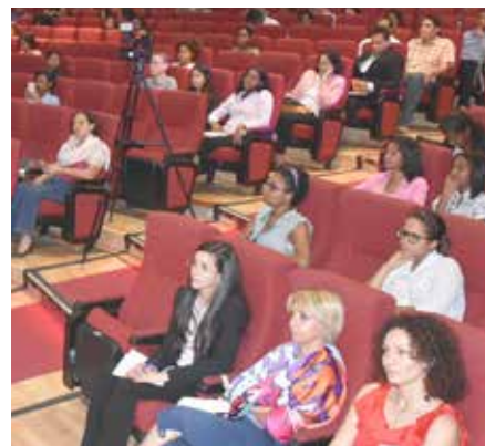
Parte de los participantes

ficiados con el programa de becas líder y jóvenes iberoamericanos de la Fundación Carolina y Banco Santander, entre cuyos organizadores figuran la Fundación Glo-