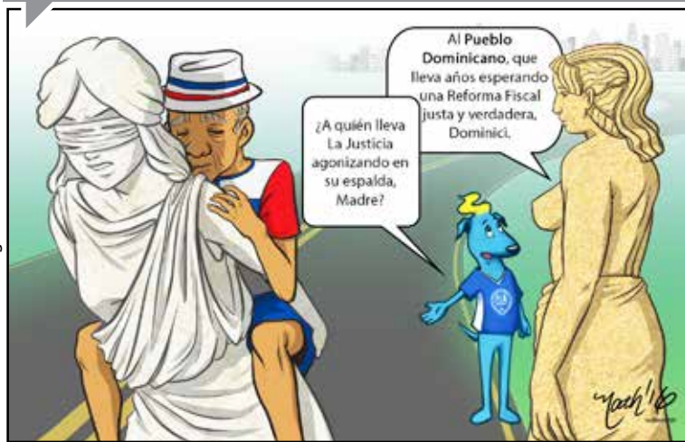
Ilustración: Nathalie Rodríguez.