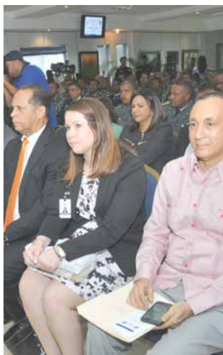
Parte de los participantes en la apertura del Diplomado.

Destacó el compromiso de la Primera Universidad del Nuevo Mundo, de seguir apoyando este tipo de iniciativa que ayuda a crear una conciencia ciudadana que contribuya a fortalecer la institucionalidad en un Estado social y democrático de derecho.