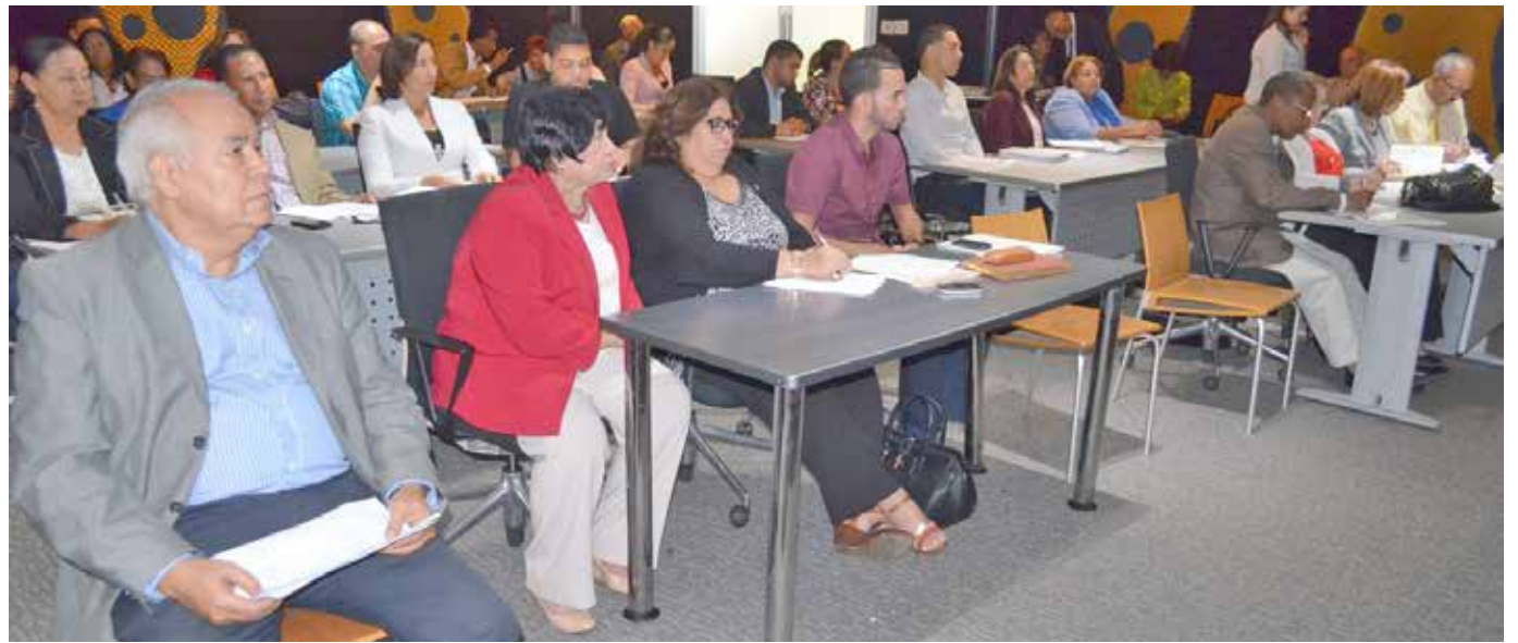
Autoridades docentes y administrativas de los centros y el sub-centro que participaron en el taller de Evaluación Institucional, acompañados por la Ministra de Educación Superior y otros funcionarios de esa cartera.

En su discurso de apertura, el rector destacó la importancia del proceso evaluativo, exhortando a los participantes en el taller a trabajar con interés y entusias-