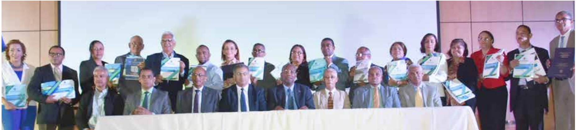
Vista de los directores y subdirectores de los recintos, centros y subcentros de la UASD que participaron en la presentación de sus Planes Estratégicos 2014-2018 y su Plan Operativo 2017.

Con el propósito de dar respuestas a las actuales demandas en el ámbito de la Educación Superior y de trabajar alineados a los propósitos que en esa materia se plantean en la Estrategia Nacional de Desarrollo hasta el 2030, las autoridades de los Centros Regionales Universitarios de la Universidad Autónoma de Santo Domingo (UASD), con el apoyo de la Dirección General de Planificación y Desarrollo Institucional (DIGEPLANDI), presentaron a los miembros del Consejo Universitario sus Planes Estratégicos 2014-2018 y sus Planes Operativos para el año 2017.