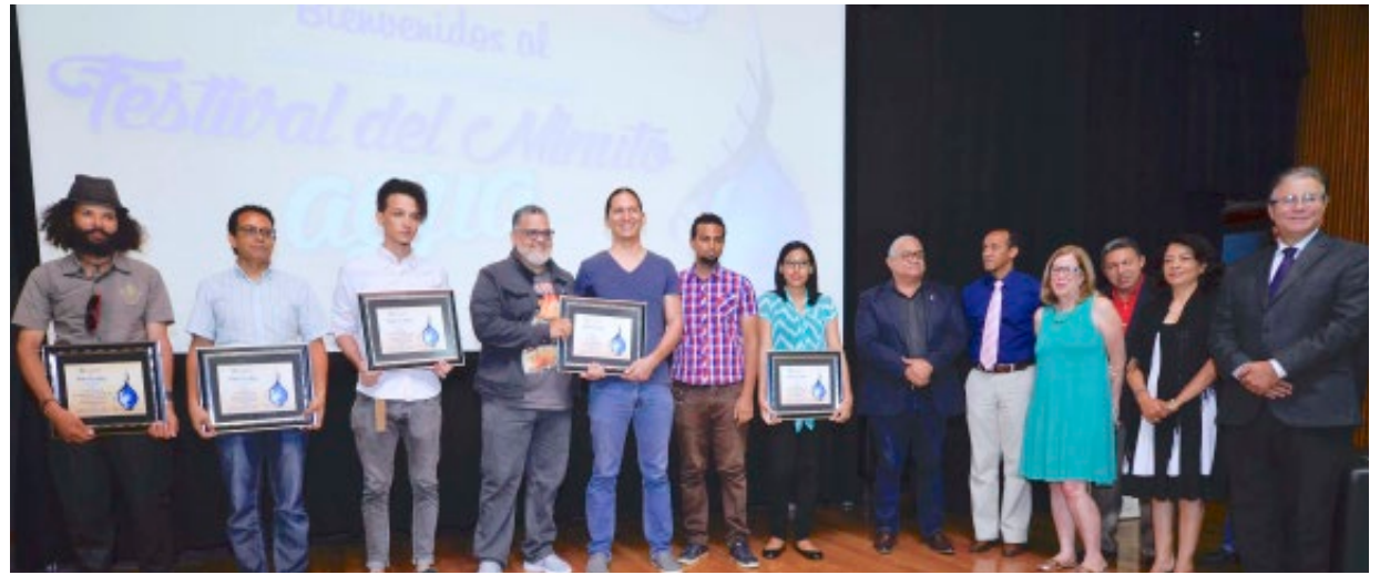
Los jóvenes que resultaron ganadores de esta nueva versión del Festival Minuto Agua, reciben los pergaminos que los acreditan como ganadores de esta nueva versión del certamen.