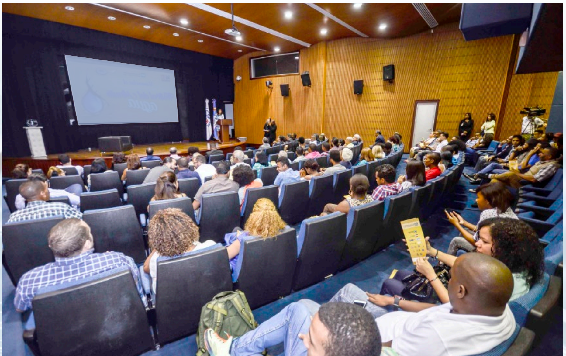
Estudiantes de las distintas universidades y público que se dio cita en el acto de premiación de los galardonados en el Festival del Minuto Agua.