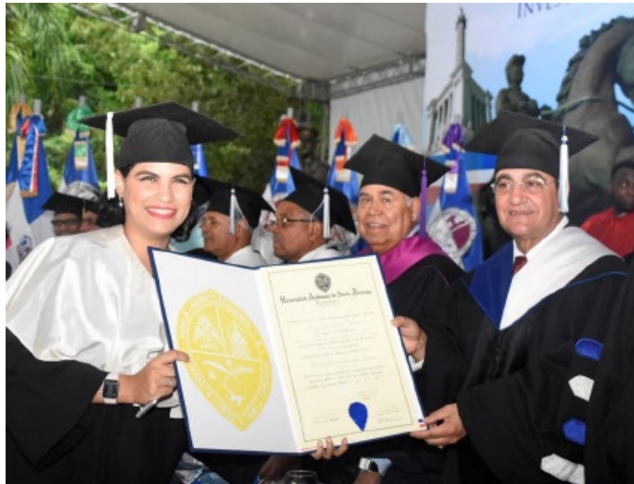
Graduandos de distintas ramas se congregaron en la Plaza Héroes de Abril, en la plaza héroes de abril del campus universitario, durante el acto de investidura ordinaria.