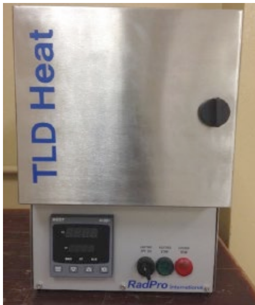
Investigación busca sintetizar dosímetros termoluminiscentes a base de nuevos materiales.