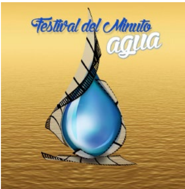
Afiche oficial del certamen.