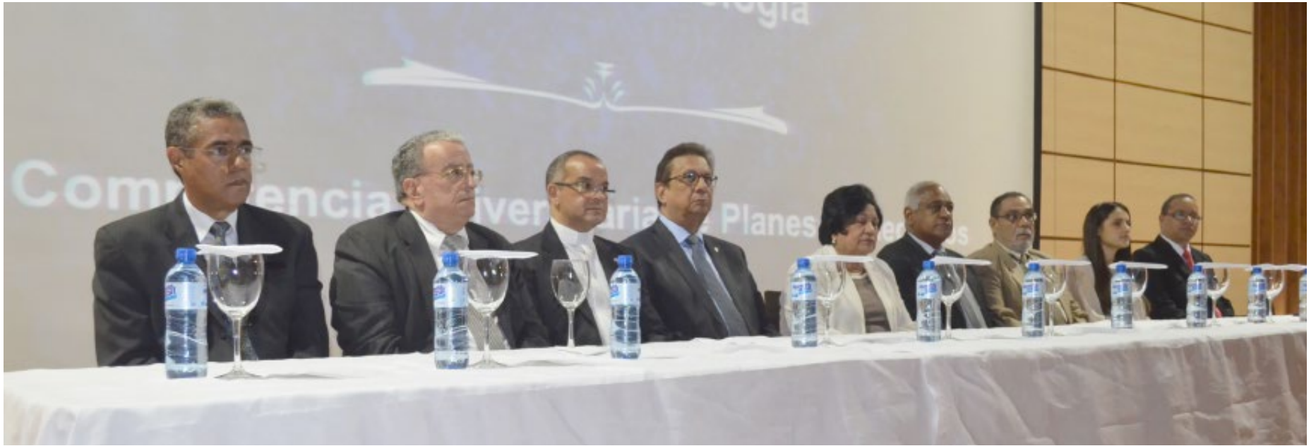
Autoridades universitarias y del Ministerio de Educación Superior que participaron en la evaluación de los participantes en la 8va Competencia de Planes de Negocios.

La novena Competencia de Planes de Negocios, que auspicia la Universidad Autónoma de Santo Domingo junto al Ministerio de Educación Superior Ciencia y Tecnología, se desarrollará en dos fases: la primera para escoger las mejores propuestas hechas por estudiantes uasdianos; y la segunda, para estudiantes de todas las universidades del país.